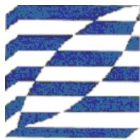
شرکت طرح نو اندیشان